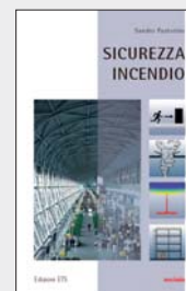
Copertina del volume "Sicurezza e Incendio"